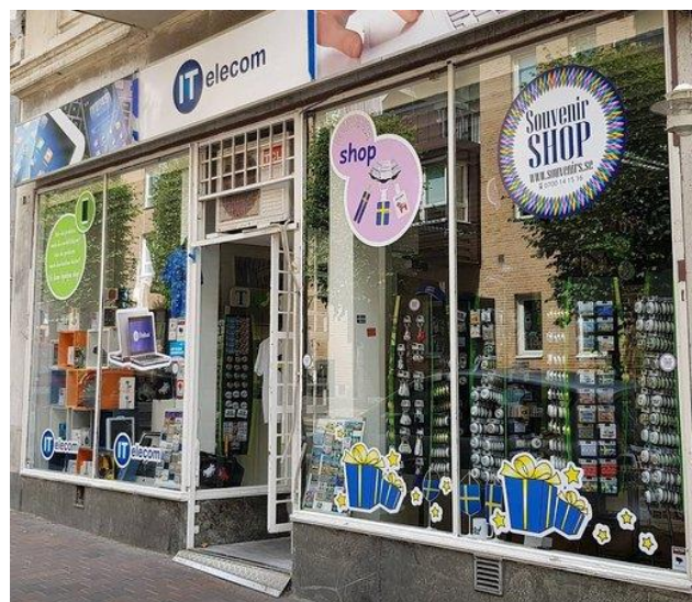
Slika 1: Primer majhne trgovine

Zunanja trgovina zajema trgovanje izven državnih meja. Trgovanje med državami sta uvoz in izvoz . Z uvažanjem država kupi izdelke, ki jih sama ne proizvaja ali jih je ceneje kupiti v tujini. Izvažanje pa je nasprotni tok.