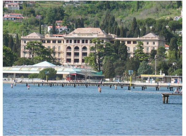
Slika 2: Obmorski turizem