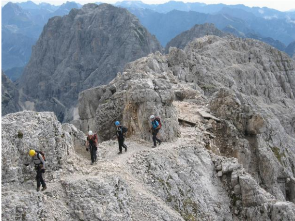
Slika 1: Gorski turizem