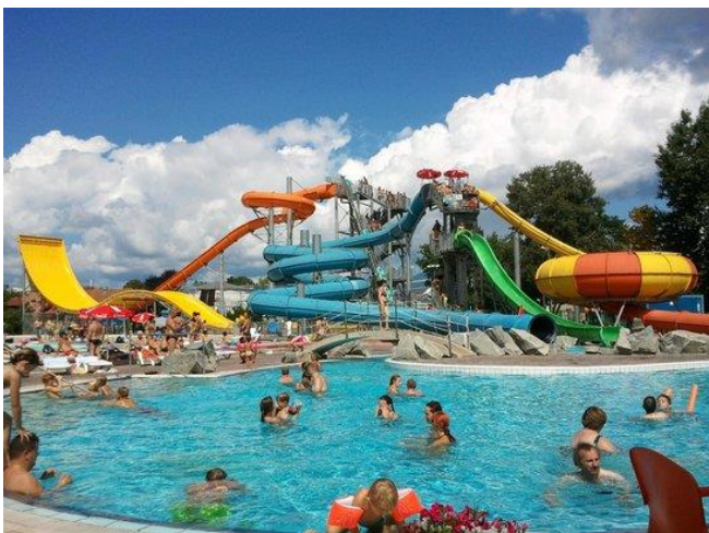
Slika 3: Zdraviliški turizem