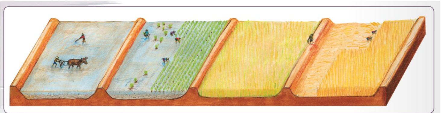
Različne faze pridelovanja riža, od oranja do žetve

V goratih in stepskih delih prevladuje nomadska živinoreja . V Tibetu je značilna pasma jak . Nomadi živijo v šotorih, ki jim pravimo jurte . Poljedelstvo se je razvilo ob velikih rekah zaradi potreb po namakanju. Zelo pomemben je riž , ki ga pobirajo tudi trikrat na leto. Pomembna je še soja, pšenica in koruza . Ribištvo je zelo pomembno v Japonski kulturi.