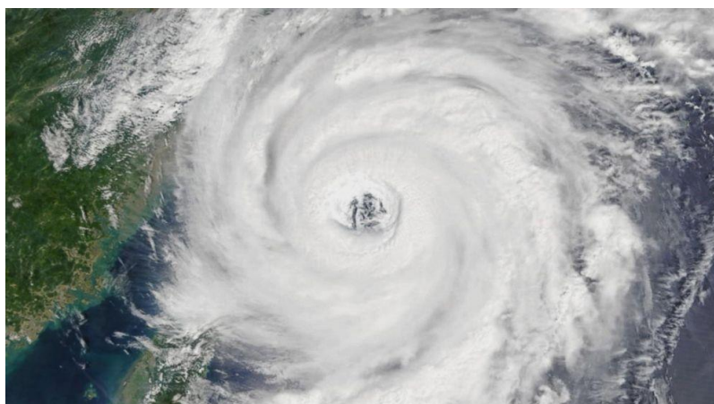
Slika 2: Tajfun