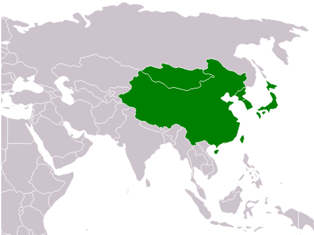
Slika 1: Vzhodna Azija

Čisto na vzhodu leži otoška država Japonska .