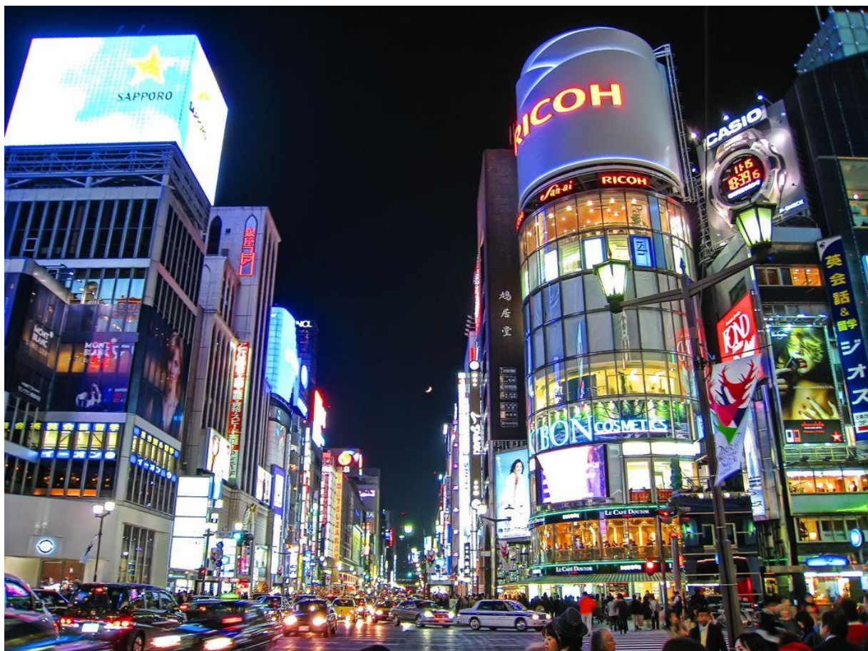
Slika 3: Glavno mesto Japonske

Po drugi svetovni vojni je država doživela velik gospodarski čudež, kjer so disciplinirani delavci z razvojem moderne tehnologije spravili Japonsko na prvo mesto na svetu iz več vidikov. Najuspešnejši so avtomobilski in elektrotehnični industriji .