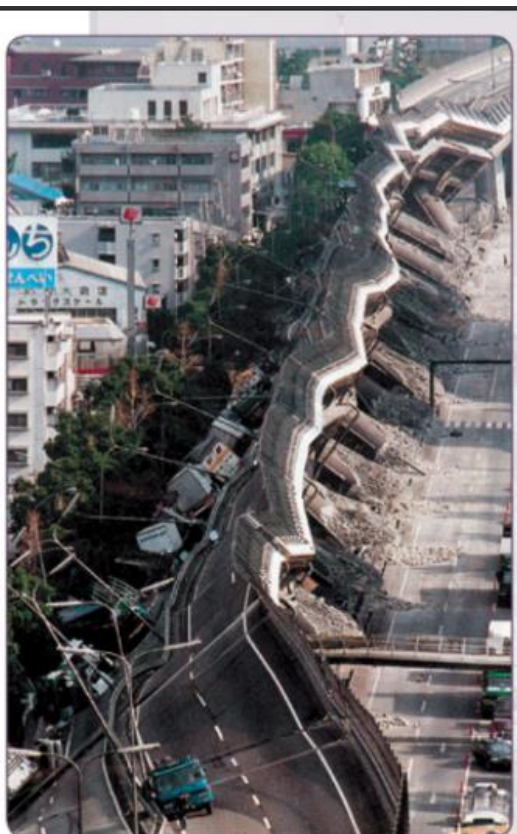
Posledice katastrofalnega potresa v Kobeju leta 1995

Zelo uničujoči so cunamiji . Sproži jih potres pod morjem, ki dvigne del morskega dna in izpodrine vodo. Moč takih potresov je zelo velika in sprožijo več cunamijev zapored. Tajfuni so orjaške nevihte vrtnčastega vetra, ki nastanejo nad toplim morjem in vetrovi pihajo več kot 250 km/h.