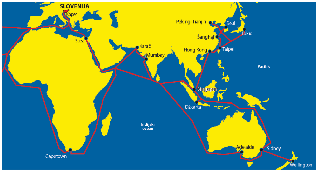
Slika 1: Pomorske poti