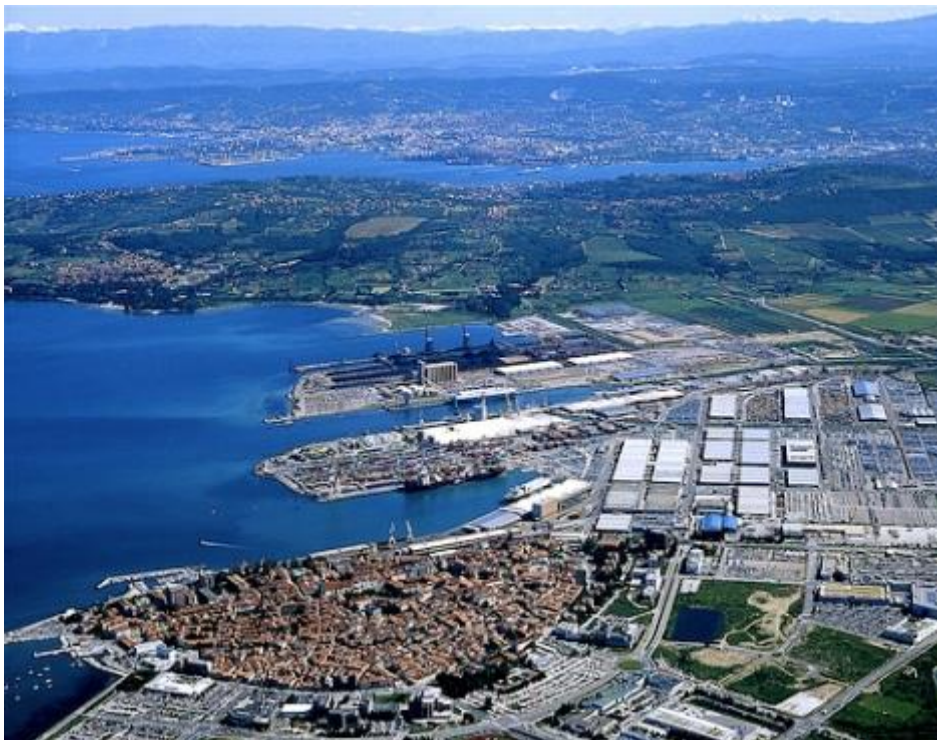
Slika 2: Luka Koper