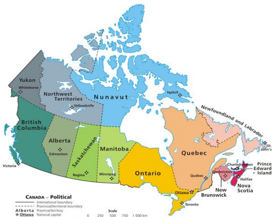
Slika 1: Politični zemljevid Kanade (ozemlja so Yukon, Severozahodni teritorij in Nunavut).

Kanada je upravno razdeljena na 10 provinc in 3 ozemlja. Province imajo precej močne pristojnosti ter relativno veliko samostojnost, medtem ko so ozemlja bolj podrejena zvezni vladi. Province in ozemlja imajo svoja lastna enodomna zakonodajna telesa.