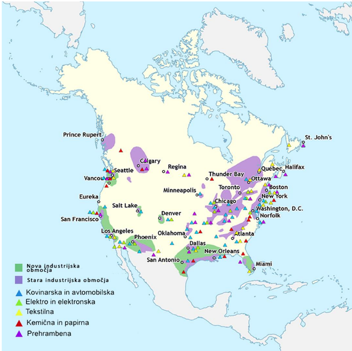
Slika 3: Razporeditev industrije v Severni Ameriki.

nafto in zemeljski plin. V Kanadi proizvedejo veliko aluminija, osnovne surovine za gradnjo letal. Zaradi vpliva ZDA se tudi v Kanadi razvijata elektronska in računalniška industrija.