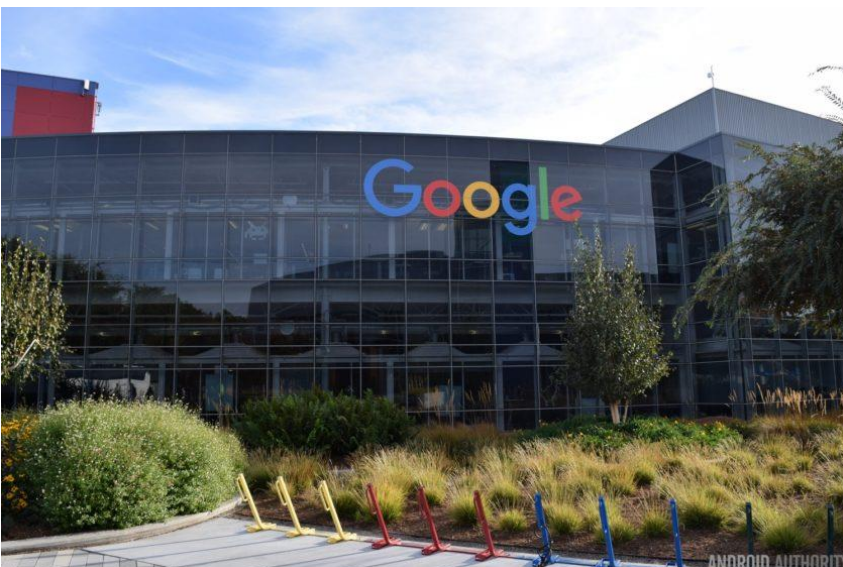
Slika 3: Google v Silicijevi dolini

Nova industrija ( industrija visoke tehnologije ), se je najbolj razvila v tako imenovani Silicijevi dolini (silicij potrebujemo v izdelavi računalniške opreme) v bližini San Francisca v Kaliforniji. Posebnost Kalifornije je tudi filmska industrija (Hollywood). Posebnost Ameriškega gospodarstva je tudi v tem, da industrijske obrate postavljajo čez mejo v Mehiki .