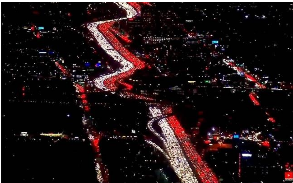
Slika 4: Prometni zamašek v Los Angelesu

https://www.youtube.com/watch?v=Uti2niW2BRA