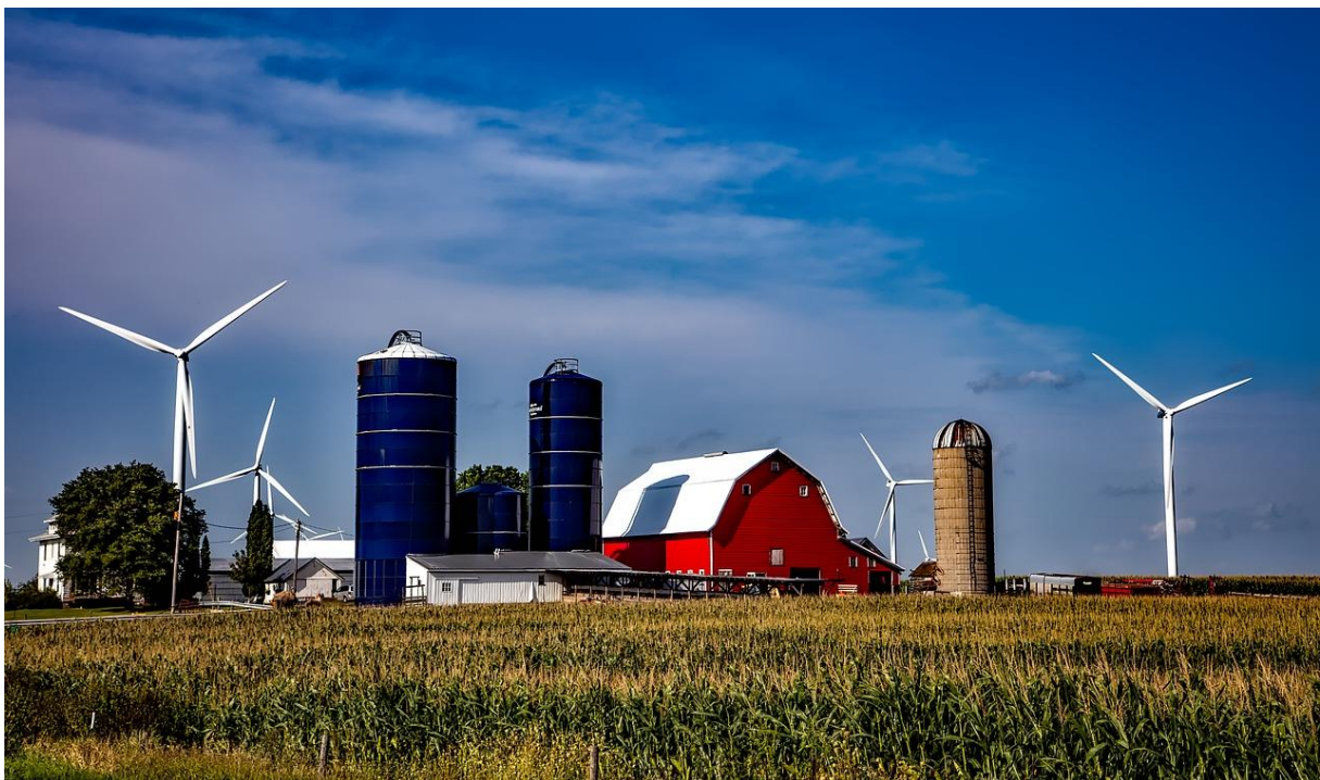
Slika 5: Tipična ameriška farma