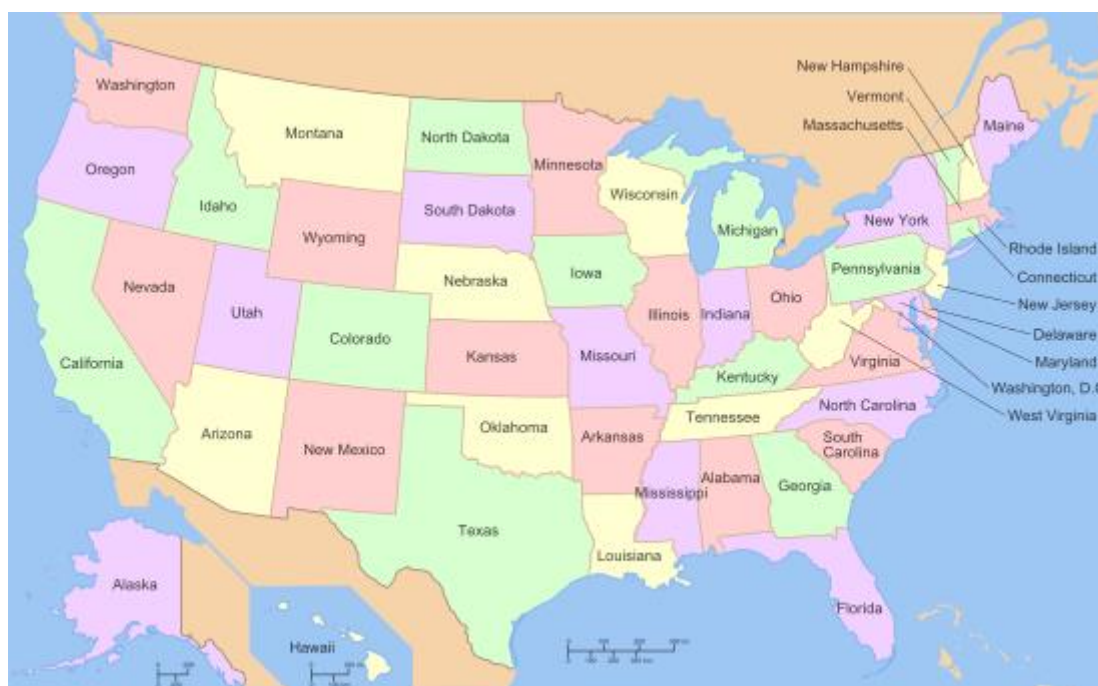
Slika 1: 50 zveznih držav ZDA

Poleg zvezni držav imamo tudi teritorije , ki spadajo pod ZDA vendar nimajo nobenih volilnih pravic. Ti teritoriji so Deviški otoki Združenih držav, Guam, Ameriška Samoa, Portoriko in Severni Marijanski otoki, drugi otoki ostajajo neposeljeni.