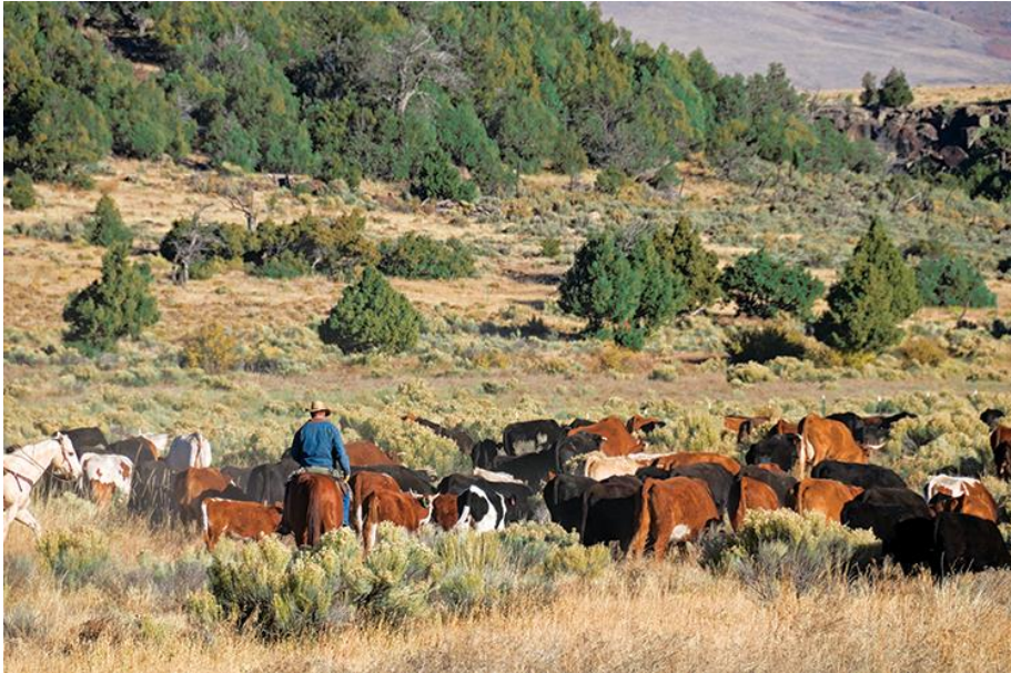
Slika 6: Delo na ranču in kavboj

Pred vikendom dobite še dodatno video vsebino, kjer se bom spustil v podrobnosti samo kot zanimivosti.