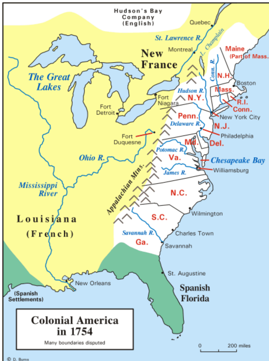
Slika 1: Prvih 13 kolonij je označeno z belo barvo.

Prvi večji val priseljevanja se je zgodil v 17. stoletju, po ustanovitvi prvih 13 kolonij v Severni Ameriki. Priseljevali so se predvsem poljedelci in pustolovci, ki so izkrčevali gozdove in osvajali nova ozemlja. Od tod se je poselitev in kolonizacija začela širiti proti zahodu .