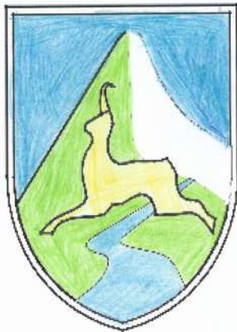
Grb in zastava občine Bovec.

Dajem z občino Bohinj je občina Bovec z vsaki občini povezana s cestami