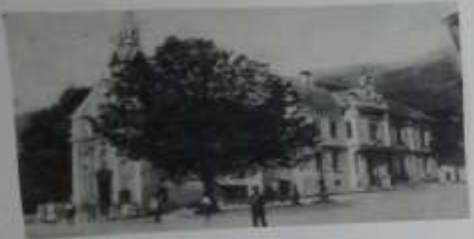
center in občina