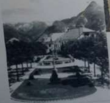
park pred hotelom Alpi