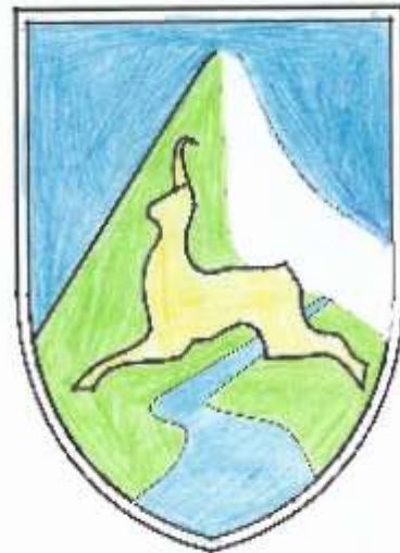
Ljubljina zastava občine Bovec.

Bovec je majhno mesto. Ljubljana je za Sočo, Log pod Mangrtom, Bovec, Sluša, Skuta, Končnica, Laga, Japonska, Jura OS Bovec s področjem Soče in Laga. OS Bovec, Laga, Laga, Laga.